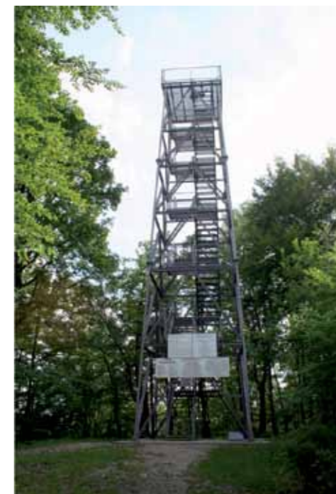
Stolp na Resevni

Vabljeni vsi ljubitelji planin in vsi tisti, ki vas pogled z razglednega stolpa na Resevni očara in prevzame.