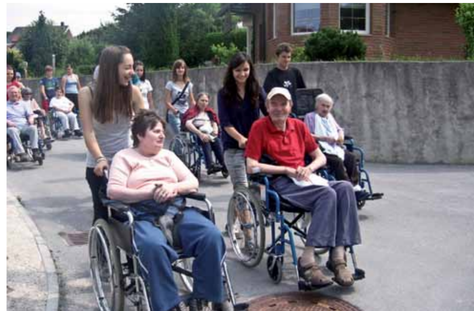
Mladi so obiskali Dom starejših v Šentjurju