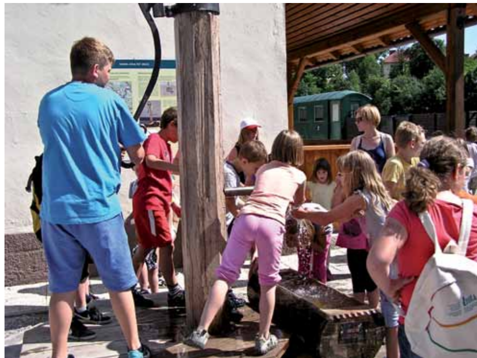
Obnovljeni vodnjak na železniški postaji v Zrečah

čju 3 km. Le v dolini Dravinje so točke blizu skupaj, tako da je možen obisk peš.