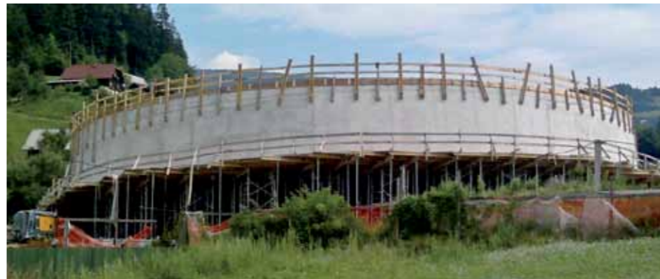
Nastajajoče središče KSEVT v Vitanju

Polet prvega človeka v vesolje, Jurija Aleksejeviča Gagarina, 12. aprila leta 1961 (leta naše mladosti, črno-bele televizije, leta po vojne rehabilitacije in leta fascinacije – tudi z videnjem Zemlje iz vesolja) praznujemo z obiskom kozmonavta Jurija Ivanoviča Malenčenka, z odprtjem ruskega kulturnega znanstvenega centra v Ljubljani in z odprtjem