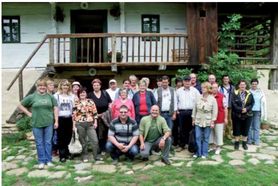
Predstavniki LAS med Snežnikom in Nanosom pred Kozjansko domačijo v Dobju