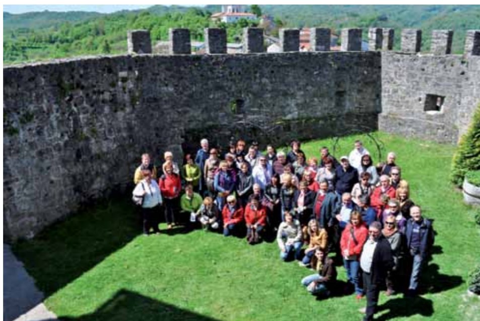
Udeleženci ekskurzije LAS