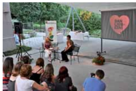
Prireditev Dan ljubezni

S projektom, katerega namen je vzpostaviti podporno okolje in model dobre prakse, ki bosta mladim v oporo pri postavljanju in realizaciji lastnih ciljev, se bo pripravil ustrezen program za podporo mladim, vzpostavila mladinska svetovalna pisarna, usposobile osebe za svetovanje mladim ter izvedla dva mladinska raziskovalna projekta, na temo izdelave strategij in modelov ustvarjalnih in uspešnih ljudi ter uspešni načini učenja.