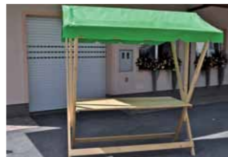
Stojnice LAS, ki jih je možno najeti