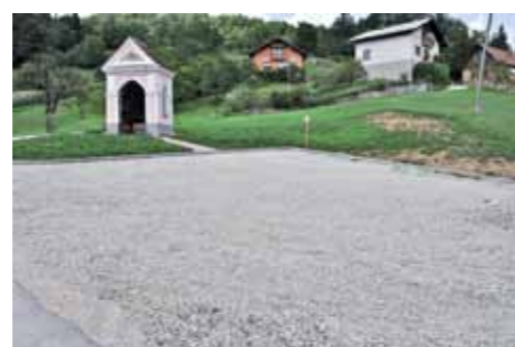
Urejeno parkirišče pri kapelici na Rifniku

Krajevna skupnost Šentju – Rifnik bo vzpostavila povezavo med muzejsko zbirko Zakladi Rifnika, ki se nahaja v Zgornjem trgu v Šentjurju, z Arheološkim muzejem Rifnik, ki se nahaja na prostem na hribu nad Šentjurjem. Ureja se prireditveni prostor Turistično informacijske pisarne Rifnik, oblikujejo se informativne table ter promocijska zgibanka, prav tako bo zasnovan integralni turistični produkt, ki bo prispeval k razvoju turistične ponudbe kraja ter njegovi večji prepoznavnosti.