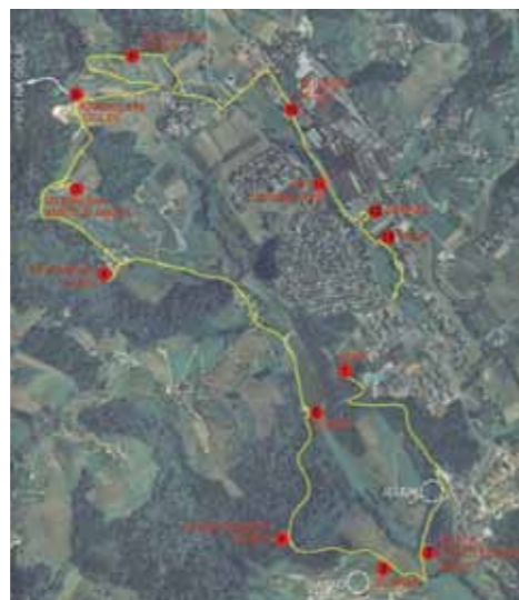
Karta srčkove učne poti

V Zrečah urejajo tematsko učno pot, ki poteka mimo 13 naravno prepoznavnih točk območja. Urejena pot bo predstavljala učni poligon za spremljanje dogodkov v naravi ter za razvijanje kulture bivanja v okolju, negovanje odnosa do narave, naravne in kulturne dediščine. S privlačnimi informativnimi in usmerjevalnimi tablami ter z učnimi objekti na posameznih točkah bo pot predstavljala bogato in koristno obogatitev obstoječe ponudbe kraja in območja.