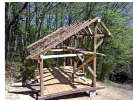
Apiterapevtski čebelnjak v nastajanju

Apiterapevtski čebelnjak je prostor, kjer lahko posameznik izboljša ali ohranja zdravje in ima možnost z vsemi čutili (vonj, sluh, vid, okus in otip) spoznati čebelo, čebelarjenje in čebelje produkte. Treba je posebej poudariti, da v našem primeru ne bo šlo za uporabo čebeljih pikov, čeprav je tudi to del apiterapije, ki se ponekod že uporablja.