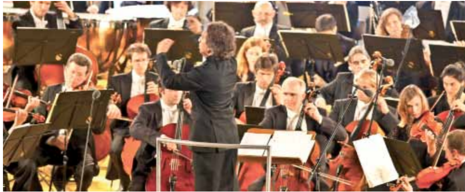
Glasbeno poletje na Dobrni

V juniju so na Dobrni odprli novo, sodobno zasnovano gozdno učno pot. Gozdna učna pot Dobrna bo na sproščen in zabaven način vsem obiskovalcem podajala znanje o gozdu in osveščala odnos do narave. Pot je zasnovana kot samovodna gozdna učna pot s predstavitvenimi točkami, na katerih table z napisami razširjajo potrebno znanje ter vsebujejo didaktične elemente, s katerimi se obiskovalca spodbudi k radovednosti in doživljanju vsebine določene predstavitvene točke. Tako obiskovalec ne bo potreboval posebnega strokovnega vodstva ali tiskanega vodnika, kljub temu pa bo izvedel veliko novega o delovanju in zgradbi gozdnega ekosistema in trajnostnemu razvoju območja. 11 predstavitvenih tabel skupaj z informativno tablo na začetku obiskovalca vodi vse od jame Lednice, skozi Drenovo sotesko, do planote Brdce in mimo kmetije Marošek. Na planoti si je mogoče v kočarski hiši domačije Šumej iz 19. stoletja ogledati črno kuhinjo in spoznati