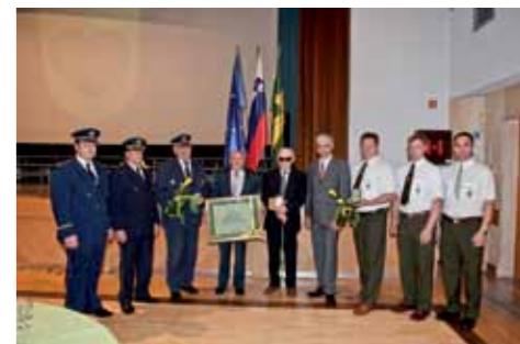
Prejemniki priznanj Občine Zreče

Srebrni grb Občine Zreče je prejelo društvo ZŠAM Zreče ob njihovi 15. obletnici delovanja. Vanj se združujejo poklicni vozniki motornih vozil vseh kategorij, avtomehaniki, vozniki gradbene, gozdne, kmetijske in druge mehanizacije ter drugi. Že tradicionalno se lotevajo projektov, ki pripomorejo k večji varnosti in prepoznavnosti v občini Zreče (spretnostne vožnje, preverjanje znanja, sodelovanje pri izvedbi kolesarskih izpitov, prvi šolski dnevi, akcija Bodi previden, bodi viden, srečanje vseh šoferjev na Rogli, izvajanje raznih akcij za šolske otroke ...). Poleg zagotavljanja varnosti v cestno prometnih predpisih so si pridobili vodnike iz svojih sredin, da lahko v času obiskov muzeja predstavijo muzej o zreškem vlaku.