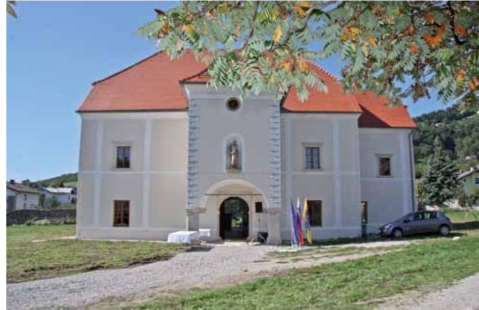
Obnovljena graščina v Oplotnici

Oplotnica, kraj pod južnimi obronki Pohorja, od vseh strani obkrožen z vinogradi, se z jedrom tišči k svoji nedavno prebujeni Trnuljčici: graščini v Oplotnici. Staro-nova gospodična se je kot pravljica oseba prebudila v življenje. Ko se ustaviš pred velikimi vrati in se ozreš nad portalom na kip Janeza Krstnika, ki te pospremi v sam objekt, se zaveš veličine