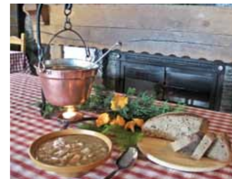
Tradicionalni Pohorski lonec

S ciljem okrepiti prepoznavnost območja Rogla – Pohorje v Sloveniji in izven meja bo oblikovana blagovna znamka Okusi Rogle. V njej bodo združeni kulinarčni, kulturni in ostali ponudniki omenjenega območja. Za zainteresirane k vključitvi v blagovno znamko bo izdelan pravilnik, ki bo določal pogoje uporabe le-te. Močan poudarek bo na promociji projekta, izvedene pa bodo tudi številne izobraževalne delavnice.