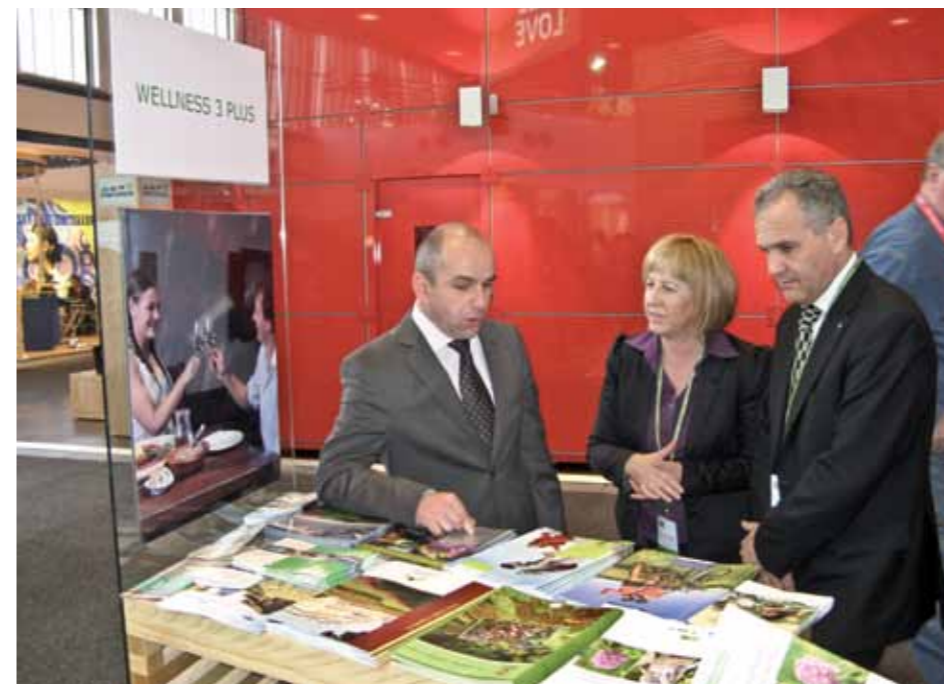
Razstveni prostor v Berlinu so obiskali številni visoki gostje iz Slovenije in tujine

Nemški turisti v Sloveniji predstavljajo zelo pomemben trg in zasedajo 11 % delež v turističnem prometu. Med njimi je največ zani-