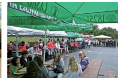
Novo igrišče ob prazniku Krajevne skupnosti Slivnica pri Celju

S ciljem okrepiti prepoznavnost območja Rogla – Pohorje v Sloveniji in izven meja bo oblikovana blagovna znamka Okusi Rogle. V njej bodo združeni kulinarčni, kulturni in ostali ponudniki omenjenega območja. Za zainteresirane k vključitvi v blagovno znamko bo izdelan pravilnik, ki bo določal pogoje uporabe le-te. Močan poudarek bo na promociji projekta, izvedene pa bodo tudi številne izobraževalne delavnice.