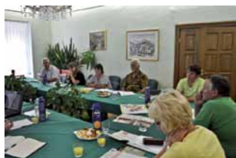
Delavnica v Vitanju

Za vse, ki želijo prispevati k razvoju podeželja sedmih občin med Pohorjem in Bohorjem, sta bili v mesecu juniju izvedeni dve delavnici, v Vitanju in na Dobrni, s predstavivjo ključnih značilnosti programa Leader in delovanja LAS. Predstavljeni so bili uspešno izvedeni projekti LAS. O njih so spregovorili prijavitelji sami ter povedali svoje izkušnje pri izvajanju projektov. Podane so bile usmeritve za pripravo ter prijavo projektne ideje na razpis Lokalne akcijske skupine »Od Pohorja do Bohorja«. Delavnice bodo izvedene še na preostalem območju LAS, in sicer predvidoma v jesenskih mesecih.