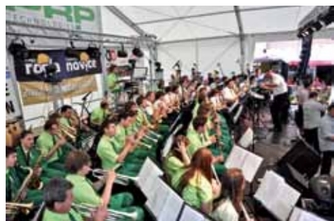
V starih Zrečah je ropotalo

Največja turistična prireditev v Zrečah je že nekaj let zapored Ropotanje v starih Zrečah. To tridnevno prireditev, ki se je dogajala od 3. do 5. junija, so skupaj organizirali Društvo godbenikov Zreče, Občina Zreče in LTO Rogla – Zreče, GIZ. K uresničitvi tridnevne prireditve je pripomoglo tudi veliko sponzorjev in donatorjev iz Zreč in okolice. Dogodki tridnevne prireditve so bili dobro obiskani, nekateri so se na sobotne in nedeljske dogodke pripeljali kar z vlakcem, ki je kot dodatna turistična ponudba za vse obiskovalce vozil po Zrečah.