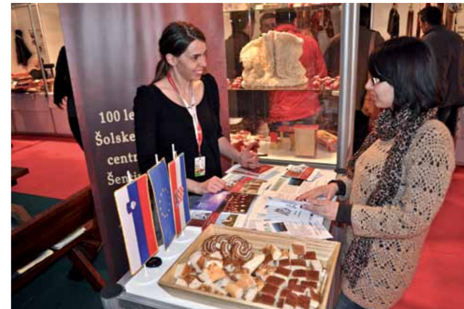
Na sejmu v Splitu se je območje predstavilo z domačimi dobrotami in barvito turistično ponudbo

manja za zdravilišča z vzporedno dopolnilno, zlasti zeleno naravnano ponudbo in zdravo lokalno gastronomijo. Najbolj cenijo neokrnjeno naravo, ki jim pomeni ključni motiv za prihod v Slovenijo.