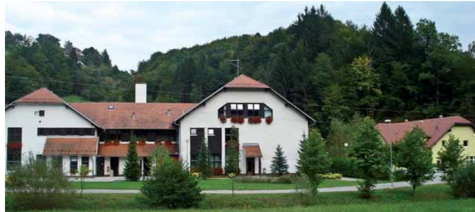
Osnovna šola Dobje