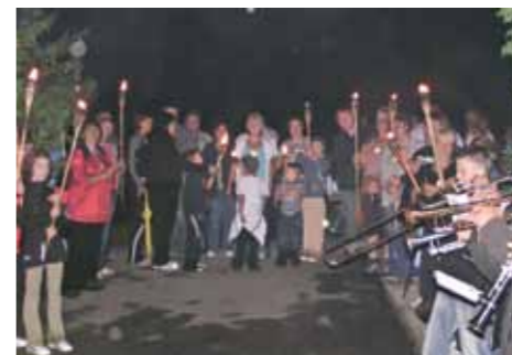
Kresni pohod po vinski cesti

Območje Podpohorske vinsko-turistične ceste (VTC-17) se razprostira vzdolž vinorodnega podokoliša, ki ga imenujemo tudi obronki Pohorja, in zajema vinogradniško področje, ki sega od občin Ruše, Maribor, Hoče – Slivnica.