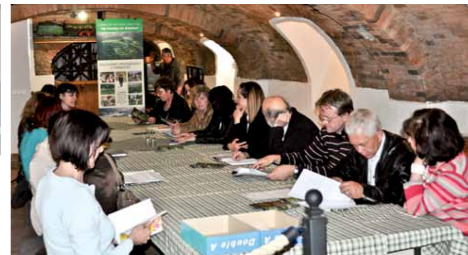
Skupščina LAS v Vinogradnikovi učni kleti v Šentjurju

bacha ter Društva Vitezi Belega Volka izvedli srednjeveške seminarje, delavnice in druge dogodke s srednjeveško vsebino. Glavni namen izvedenih aktivnosti je bil seznaniti obiskovalce z načinom življenja v tem zgodovinskem obdobju, oživiti dogajanje na Konjiškem gradu ter prispevati k oživiljanju zapuščenega kulturno zgodovinske dediščine.