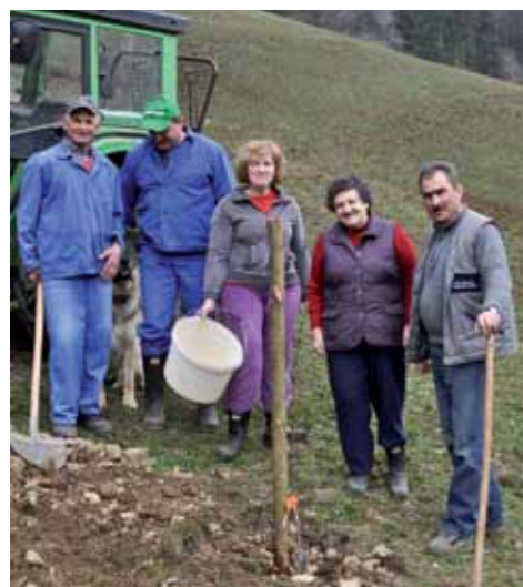
Zasaditev travniškega sadovnjaka na Dobrni

S ciljem osvestiti prebivalstvo o pomenu travniških sadovnjakov pri ohranjanju okolja ter o pozitivnih vplivih sadja v prehrani se izvajajo predavanja na to temo. Pripravljena je bila razstava starih sort sadja, izveden je bil prikaz rezi starih jablan ter predelave sadja z različnimi vsebinskimi sklopi. Na prireditvi Dobrote slovenskih kmetij na Ptujju se je predstavilo 67 razstavljalcev s svojimi sadnimi izdelki. Prav tako se je oživilo sedem travniških sadovnjakov z zasaditvijo sadik visoko-debelnih dreves na območju LAS.