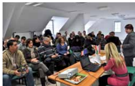
Predstavniki Zadarske županije na predstavitvi LAS »Od Pohorja do Bohorja«

Za predstavnike organizacije UNDP – United Nations Development Programme in ostalih organizacij Zadarske županije smo 15. decembra 2010 organizirali strokovno ekskurzijo po zimsko obarvanem območju LAS »Od Pohorja do Bohorja«. Najprej smo jim na Razvojni agenciji Kozjansko predstavili proces snovanja in delo LAS ter izvajanje Lokalne razvojne strategije. Sledili so ogledi dobrih praks izvedenih Leader projektov na terenu: ogled Vinogradnikove učne kleti v Šentjurju, vzpostavljene tržnice v Slovenskih Konjicah in obnovljene Železniške postaje v Zrečah. Na koncu so jim na Zlatem griču pripravili kosilo in ogled ter degustacijo v moderni vinski kleti.