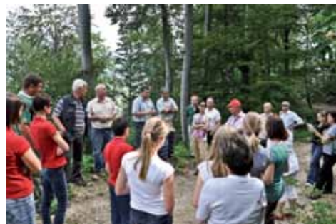
Z gozdarji na Konjiški gori

ga delovanja smo se sprehodili po zanimivi Konjiški gori.