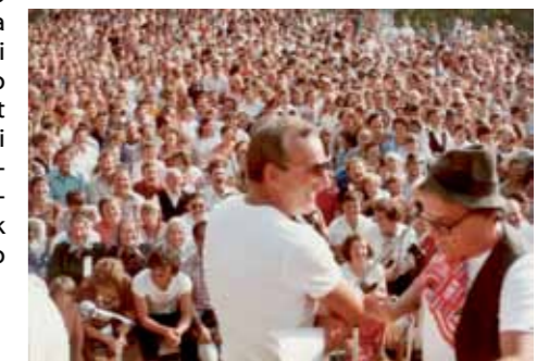
Utrinek z 20. prireditve leta 1991