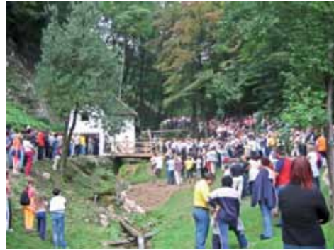
Obiskovalci mlinarske nedelje

Vidimo se 28. 8. 2011 od 14.30 dalje pri Vovkovih v Dolini mlinov!