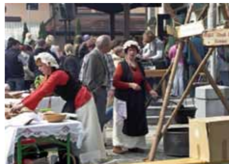
Utrinek s Konjiškega gradu

Na Konjiškem gradu so v poletnih mesecih člani Kulturnega društva Vitezi grofa Tatten-