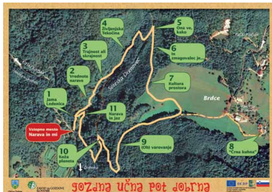
Potek Gozdne učne poti Dobrna

23. junij je bil namenjen konjiškemu gozdarjem in v njihovi družbi in ob predstavitvi njihove-