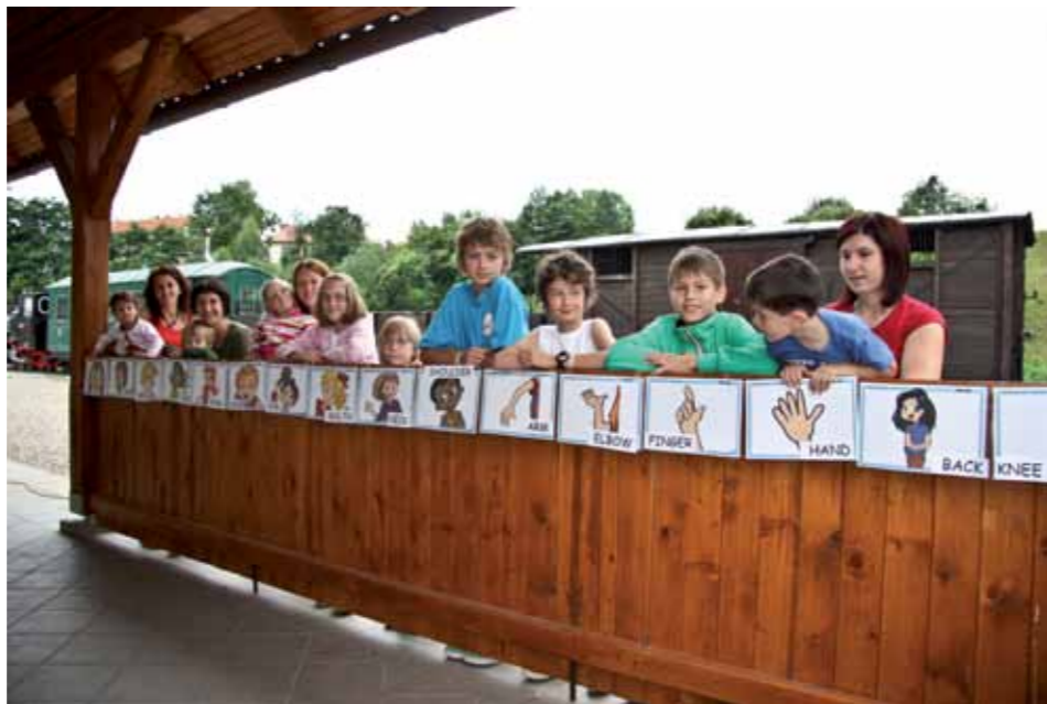
Mladi v Zrečah se zabavajo in učijo

Ena najodmevnejših je zagotovo prireditev Eko čarovnije. Prireditev utrjuje in promovira pozitivne vrednote in vzgaja otroka in mlado stnika, da bi mu skrb za okolje in naravo postala del življenja. Prireditev je postala že tradicionalna, saj smo letos izvedli že tretje Eko čarovnije, ki so na sončno aprilsko nedeljo v prelep ambient zreške železniške postaje privabile več kot 100 otrok in odraslih. Istočasno sta se tam odprla star vodnjak in vodna ladna pot. Čarodejke iz Društva prijateljev mladine Zreče so pripravile raznovrstne ustvarjalne delavnice, kjer so lahko otroci in odrasli oblikovali iz gline, polstili iz volne, izdelovali eko klobuke, izvajali poskuse z vodo, degustirali bio palačinke, sladoled in zdrave napitke ter preizkusili svoj pevski talent na karaokah. Otroška prireditev se je prelevila v pravi otroški festival, saj so se nam pridružili še zreški konjeniki, člani ZŠAM Zreče in KUD Vladko