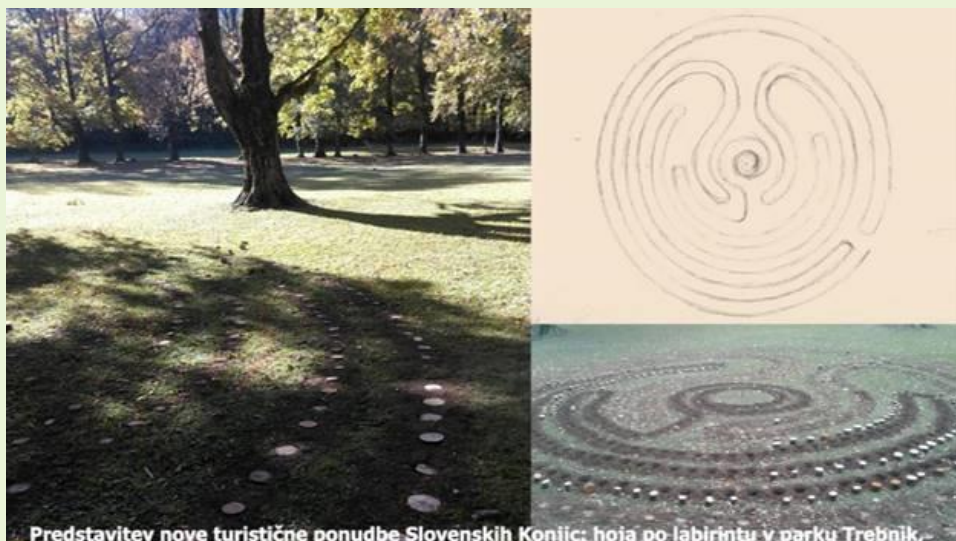
Predstavitve nove turistične ponudbe Slovenskih Konjic; hoja po labirintu v parku Trebnik.